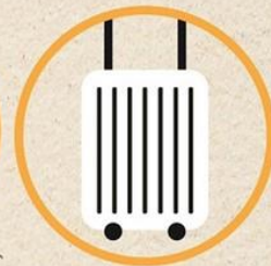
เพิ่งกลับจาก พื้นที่เสี่ยง

ถ้าเริ่มมีอาการเหล่านี้ภายใน 14 วัน หลังจากไปพื้นที่ระบาดที่ได้รับการประกาศอย่างเป็นทางการ ควรรีบไปพบแพทย์