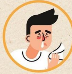
มีน้ำมูก